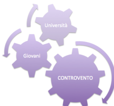
Progetti di educazione alla partecipazione civica

I PROGETTI DI EDUCAZIONE ALLA SOSTENIBILITÀ COINVOLGONO DIRETTAMENTE E PRIMARIAMENTE UNA MOLTITUDINE DI STUDENTI DELLA SCUOLA DELL'INFANZIA E DELLA SCUOLA PRIMARIA. DURANTE LA LORO IMPLEMENTAZIONE, GLI EDUCATORI TRASMETTONO AI RICEVENTI UN METODO DI LAVORO, DEI CONTENUTI, DEGLI OBIETTIVI E, INEVITABILMENTE, DEI VALORI. DI QUESTI BENEFICIANO PER PRIMI ANCHE I DOCENTI, CHE HANNO L'OPPORTUNITÀ DI ARRICCHIRE COSÌ IL LORO BAGAGLIO PROFESSIONALE. IN SECONDO LUOGO NE BENEFICIANO LE FAMIGLIE CHE, GRAZIE ALLA TRASMISSIONE DA PARTE DEI FIGLI E DELLA SCUOLA, VIVONO LA TRASFORMAZIONE IN ATTO.